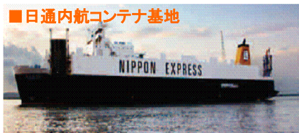
■日通内航コンテナ基地