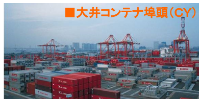
■大井コンテナ埠頭(CY)