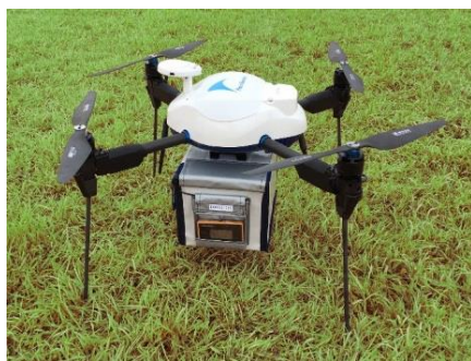
ドローン機体(エアロセンス)

医薬品や日用品などの恒常的な配送体制維持が困難となりつつある地域の課題解決と、ウィズコロナ時代における診療・服薬指導及び配送時の感染リスク低減に貢献してまいります。